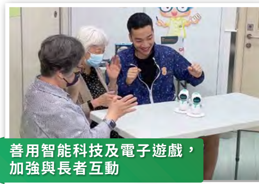
善用智能科技及電子遊戲， 加強與長者互動