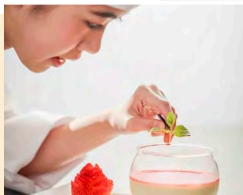
甜品及咖啡店營運