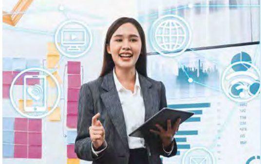
公關及多媒體傳訊