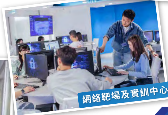
網絡靶場及實訓中心