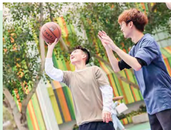
運動及體適能教練