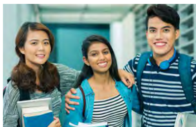
應用學習中文 (非華語學生適用)