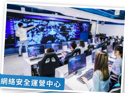
網絡安全運營中心