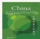
China Journal of Social Work