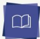
ProQuest Ebook Central