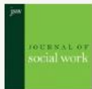
Journal of Social Work