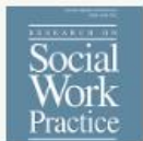
Research on Social Work Practice